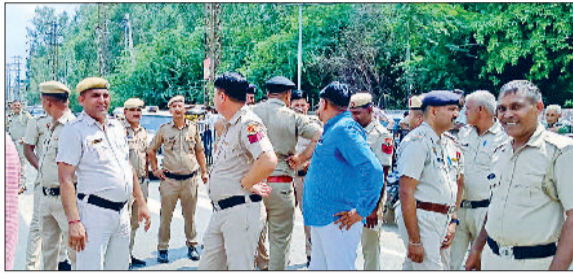
जींद। जाम लगने के बाद मौके पर पहुंची पुलिस।