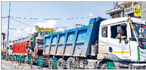
जींद। जाम लगने के बाद नेशनल हाईवे पर लगी वाहनों की लंबी कतार।