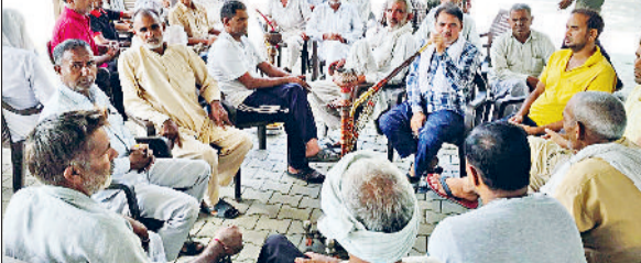
पाई। पाई में बैठक करते किसान।

उनको बताया गया कि सितम्बर माह में खाद आने की सम्भावना है। फसल में खाद तो अब डाला जाना है। सितम्बर का भी पक्का पता नहीं कि खाद आयेगा या नहीं। उन्को पिछले छः माह से ऐसे ही बहकाया