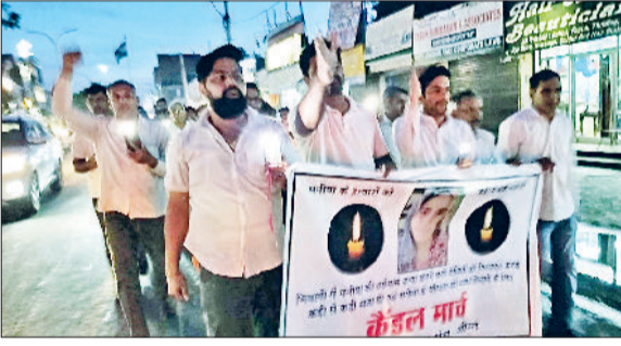
जींद। कैडल मार्च निकालते जनसंगठनों के कार्यकर्ता।