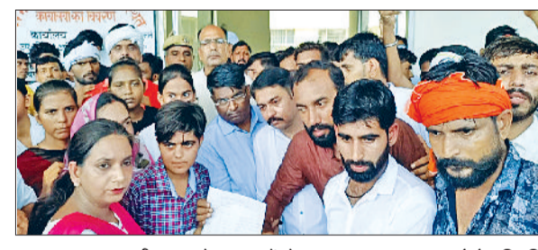
उचाना। नायब तहसीलदार को ज्ञापन सौंपते हुए।

लेकिन एसीएस ने दौरा कर इसमें कुछ अन्य सुझाव दिए। उन सुझाव के आधार पर इस भवन और चाहरदीवार का बजट बढ़कर लगभग 14 करोड़ रुपये बना। इस राशि से अस्पताल के अंदर के सुधार, शौचालय, जर्जर भवन के सुधार के लिए काम होगा। इसके अतिरिक्त बाहर की चाहरदीवारी व कुछ अन्य माइनर वर्क के लिए एस्टीमेट तैयार करवाया तो बजट लगभग 15 करोड़ रुपये का बना। सबसे बड़ी बात है कि इस भवन का लेंटर टपक रहा है। लेंटर की हालात ज्यादा कंडम होने के कारण अस्पताल पर खर्च होने वाली राशि का भी डर रहेगा। हालांकि एसीएस ने कार्य में देरी न हो इसके लिए स्वास्थ्य विभाग व पीडब्ल्यूडी से कार्य करवाने के लिए कमेटी में एडीसी को भी शामिल किया था।