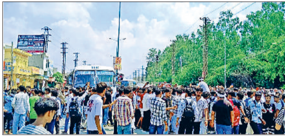
जींद। नेशनल हाईवे पर बस स्टैंड के सामने जाम लगाए युवा।