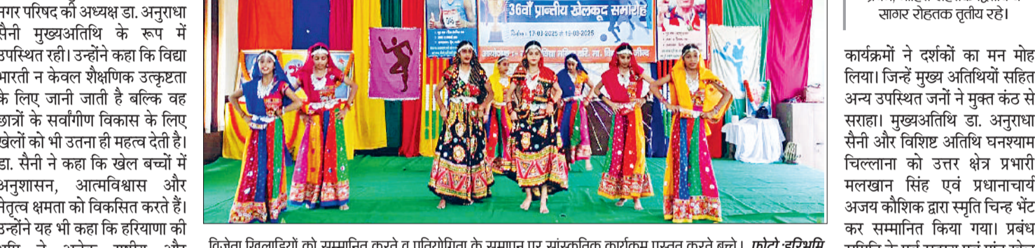
विजेता खिलाड़ियों को सम्मानित करते व प्रतियोगिता के समापन पर सांस्कृतिक कार्यक्रम प्रस्तुत करते बच्चे।