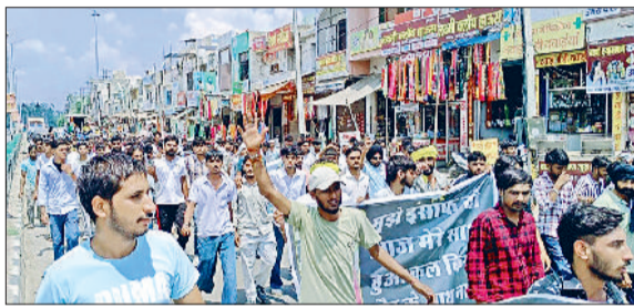
जींद। शहर में विरोध प्रदर्शन करते युवा।