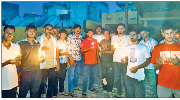
राजौड़। गांव कसान में कैडल मार्च निकालते ग्रामीण।