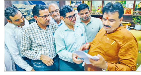
जींद। डिप्टी स्पीकर को ज्ञापन सौंपते कमेटी सदस्य।