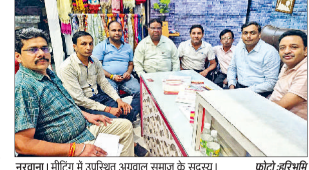
नरवाना। मीटिंग में उपस्थित अग्रवाल समाज के सदस्य।