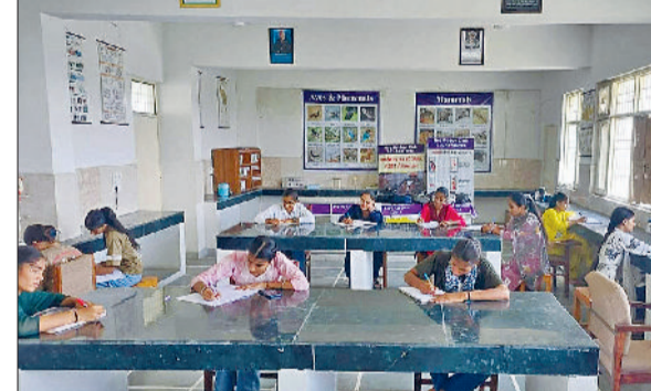
अलेवा। राजकीय महाविद्यालय अलेवा में प्रतियोगिता में भाग लेते विद्यार्थी।