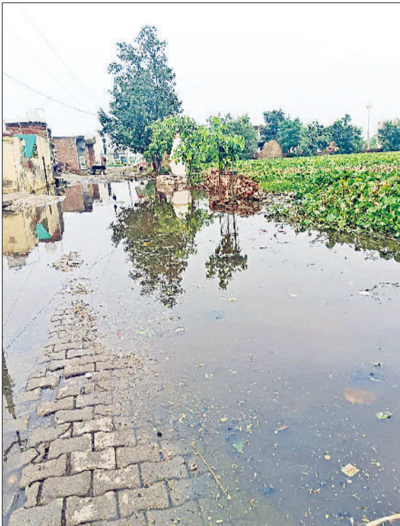
कैथल। बरटा गांव में गली में जमा गंदा पानी।

बरटा गांव की छिंदड पट्टी में तालाब ओवरफ्लो होने के कारण मुख्य गली में पानी जमा होने से ग्रामीणों को भारी परेशानी का सामना करना पड़ रहा है। यह गली न केवल गांव को संगतपुरा रोड से जोड़ती है बल्कि यहाँ ग्रामीणों की आस्था के केंद्र 2 मंदिर भी है जिनमें जाने के लिए ग्रामीणों को इस पानी में से गुजरना पड़ता है। तालाब ओवरफ्लो होने से पानी गली में खड़ा रहता है, जिससे यहां से गुजरने वाले लोगों को मजबूरन गंदे पानी में से निकलना पड़ता है। स्थानीय निवासियों ने बताया कि उन्होंने इस समस्या के बारे में कई बार ग्राम पंचायत को अवगत करवाया है लेकिन अब तक इस दिशा में कोई कार्रवाई नहीं की गई है। वहीं ग्राम पंचायत की ओर से तालाब ऊपर फाइल लगाई गयी है लेकिन बजट पास न होने के कारण