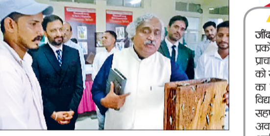
जीद। कार्यक्रम में भाग लेते गणमान्य लोग।