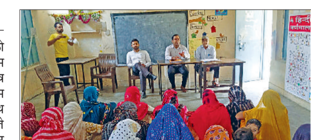
कैथल। ग्राम सभा करते जिला प्रशासन के कर्मचारी।

जिला की नौ ग्राम पंचायतों को स्वतंत्रता दिवस पर विशेष ग्राम सभा आयोजित की गई। इसमें गांव में बाल विवाह निषेध अधिनियम की पूर्ण पालना करने के साथ-साथ बाल विवाह करने करने वाले परिवार का सामाजिक बहिष्कार करने का प्रस्ताव पास किया गया। ग्राम सभा में प्रस्ताव पारित किया जाए कि ग्राम सभा के सभी सदस्य बाल विवाह का पुरजोर विरोध करते हैं और भविष्य में यदि कोई भी